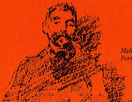
Mallarmé Portrait par Whistler