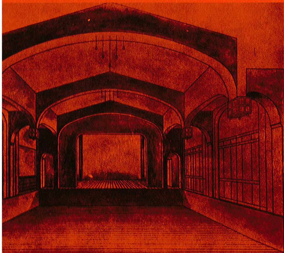
Jouvet, la scène et la salle du Vieux-Colombier en 1913

titulée "Vingt Ans de Théâtre" a été prêtée gracieusement par l'Ambassade de France