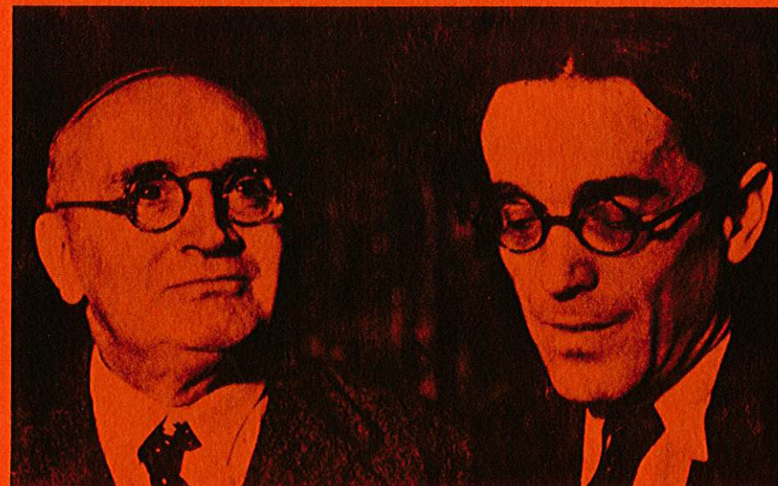
Claudel et Georges Pitoëff