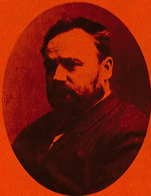
Portrait de Zola

Colloque organisé avec l'aide du Conseil des Arts du Canada