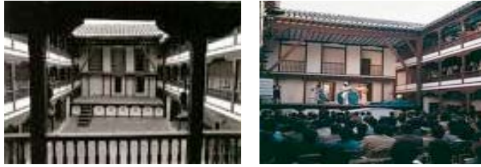
Spanish 3326F Teatro del Siglo de Oro (2009-10)